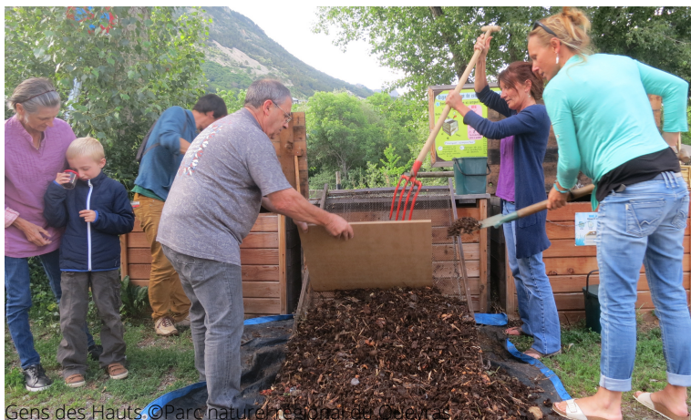
Gens des Hauts.

• 7 catalogues thématiques d'initiatives sélectionnées parmi les 180 recensées dans les parcs-pilotes.