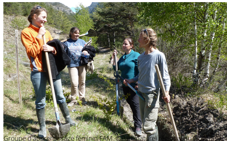
Groupe d'apprentissage féminin FAM.