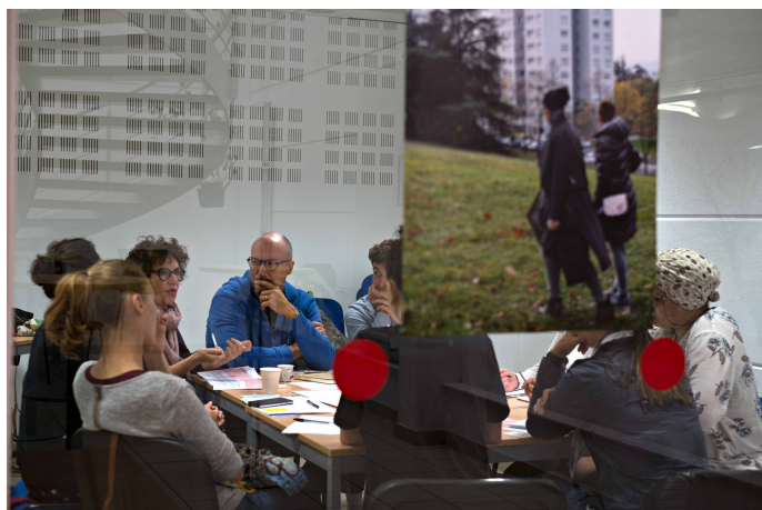
Atelier sociopôle à Vénissieux.

Dans ce cadre, un partenariat avec France Bénévolat Ile de France a été initié sur la thématique de la solidarité intergénérationnelle, le programme a été renommé ELSI « Écosystèmes Locaux de Solidarité Intergénérationnelle » pour souligner l'engagement vers un dispositif écosystémique. Les actions ont été engagées en mars 2020, avec une méthodologie affinée.